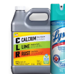
Residuos domésticos peligrosos