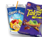
Bolsas de aluminio plastificado