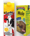
Envases de cartón plastificado