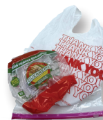
Bolsas de plástico y envoltura de plástico adherente

Sitios especiales de recolección para estos artículos y también para aparatos electrónicos, electrodomésticos, residuos de jardinería, entre otros.