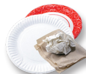
Toallas de papel, servilletas, platos de papel