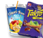
Bolsas de aluminio plastificado