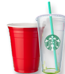
Vasos de plástico