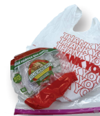
Bolsas de plástico y envoltura de plástico adherente

Sitios especiales de recolección para estos artículos y también para aparatos electrónicos, electrodomésticos, residuos de jardinería, entre otros.