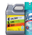
Residuos domésticos peligrosos