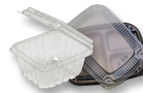
Contenedores de plástico tipo almeja

Artículos no aceptados para recolección residencial o planta de reciclaje