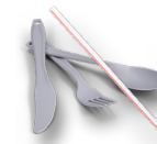
Utensilios y popotes o pajillas de plástico