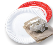
Toallas de papel, servilletas, platos de papel