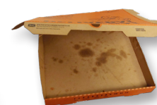
Cajas de pizza