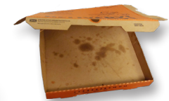
Cajas de pizza