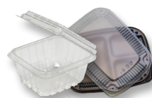
Contenedores de plástico tipo almeja

Artículos no aceptados para recolección residencial o planta de reciclaje